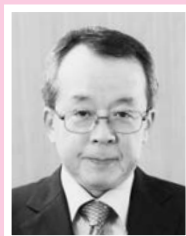
獨協医科大学 産科婦人科学教室 教授