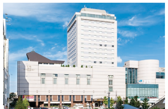
▲会場のホテルクレメント徳島